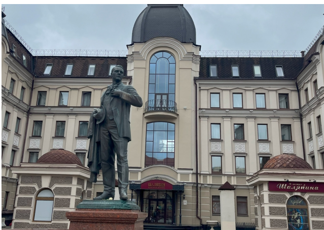
NEWS.ru Отель «Шалапин»

NEWS.ru решил узнать, как эти отели готовились к приему и встречали иностранные делегации. Чтобы попасть в здание отеля «Шалапин» (находится на главной пешеходной улице Казани — Баумана), корреспонденту пришлось продемонстрировать охране свой бейдж участника саммита и пройти через рамку металлоискателя. К сожалению, руководство гостиницы от общения с NEWS.ru отказалось. После 20-минутного ожидания девушка на ресепшене сообщила, что с нами «при необходимости свяжутся».